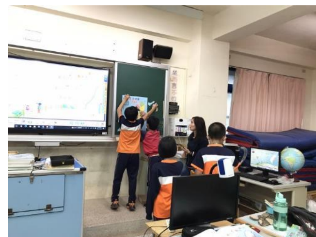
透過語詞拼圖遊戲，提升學生學習興趣，進而了解縣市的地理位置。