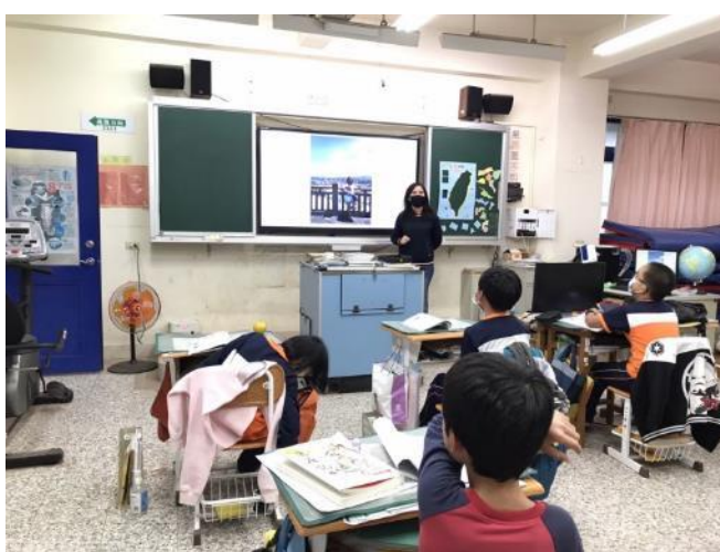
引起動機：教師分享到各縣市旅遊的經驗。