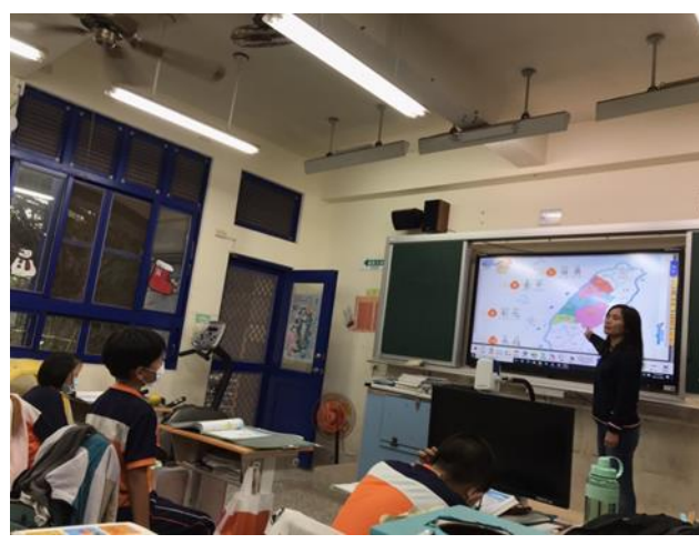
老師一一介紹各縣市時，反覆複誦縣市名稱，發揮真正有效的學習。