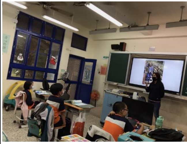
請學生分享到各縣市旅遊的經驗