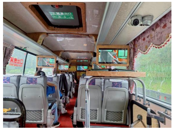
交通出發前檢查及逃生演練