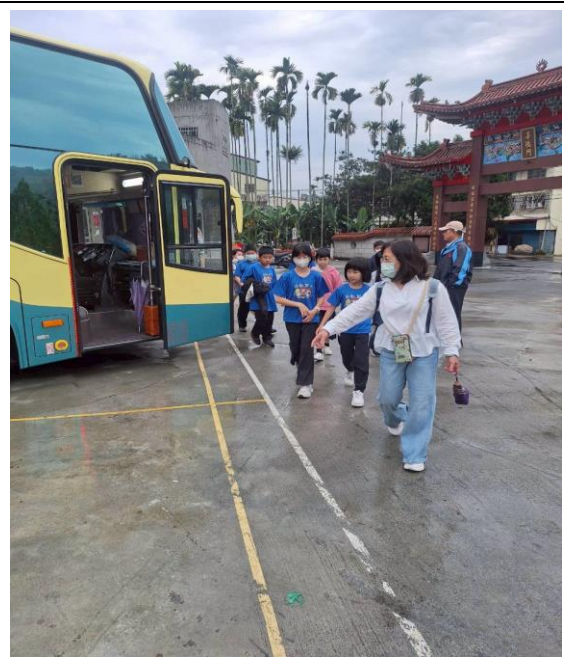
指導學生乘車安全