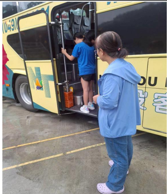
指導學生乘車安全上下車安全方式