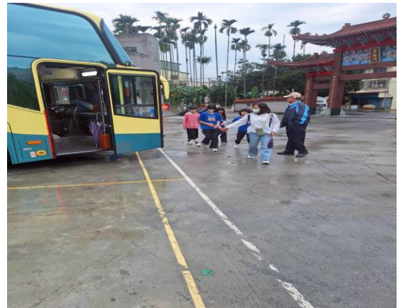
指導學生乘車安全