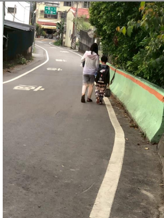
家長帶領學生步行一段路進出校園