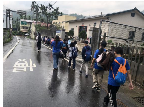
老師帶領學生步行一段路進出校園