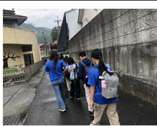
老師帶領學生步行一段路進出校園